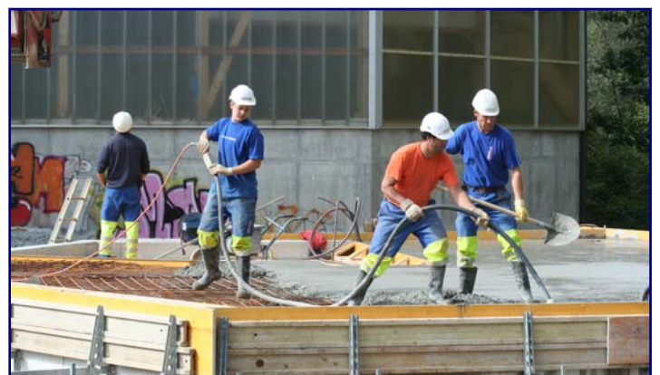
Die zweite Decke wird am 26. September betoniert (rechts).