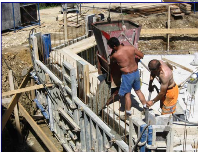
25. Juni: Einschalung der letzten Kellerwände vom Boulderraum (rechts)