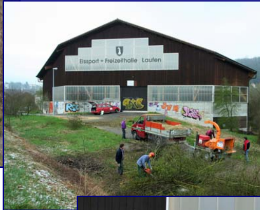
31. März 2007: Das Baugelände wird gerodet