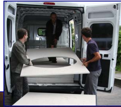
Juli 2007: an den Platten zur Kletterwand wird bereits gearbeitet