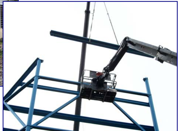
Am 30. Oktober kann der letzte Stahlträger zum Dach eingesetzt werden (oben)