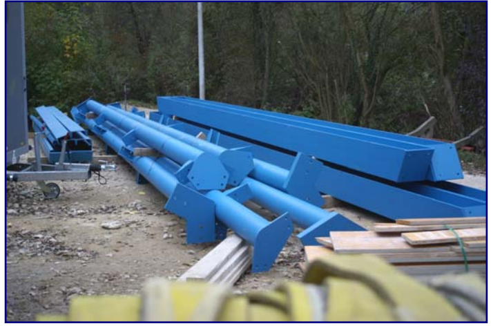
8. Oktober: Die Maurerarbeiten konnten abgeschlossen werden. Der Stahlbauer beginnt am 23. Oktober 2007, 24. und 25. Oktober (unten)