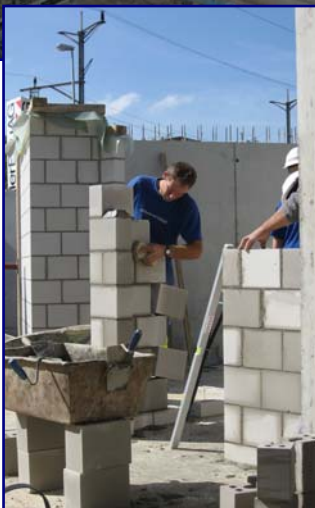
Am 12. September kann wieder gearbeitet (links)