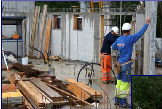
2. Juli 2007: der Boden beim Eingang (oben), der Eingangs- bereich (rechts) am 11. Juli