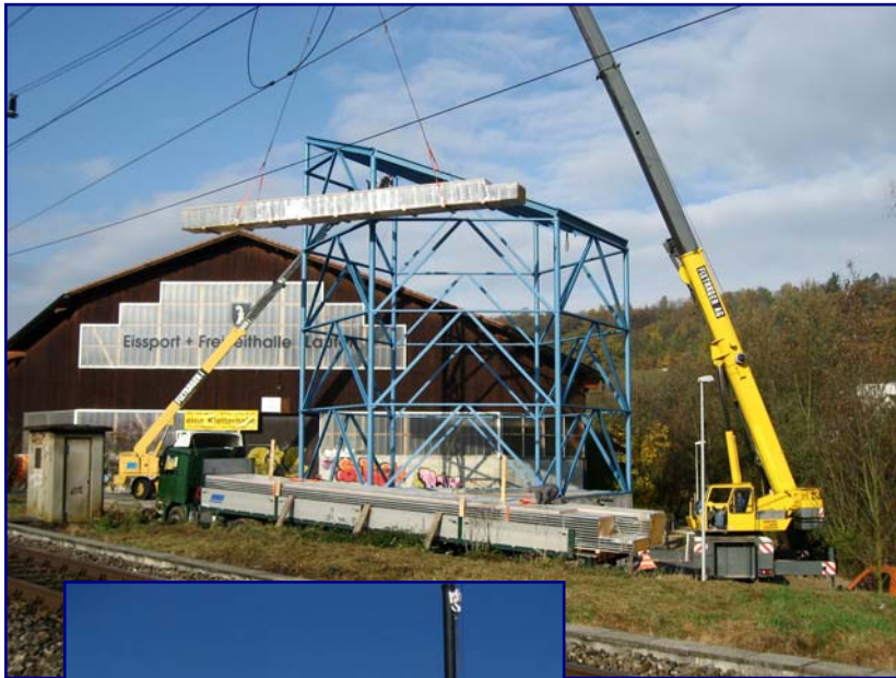
Die Fassadenelemente werden am 10. Oktober angeliefert (←) und mit dem Einbau dieser beginnt man am 2. November (↓)