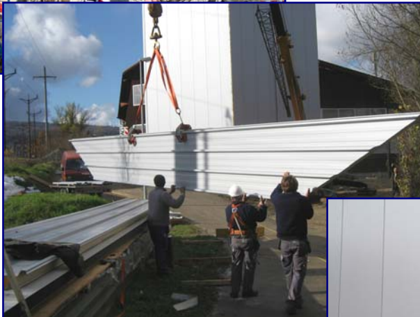
12. November: Die Dachelemente werden eingesetzt ←; das Fensterband mitte November ↓; Ende November ist der Rohbau fertig →