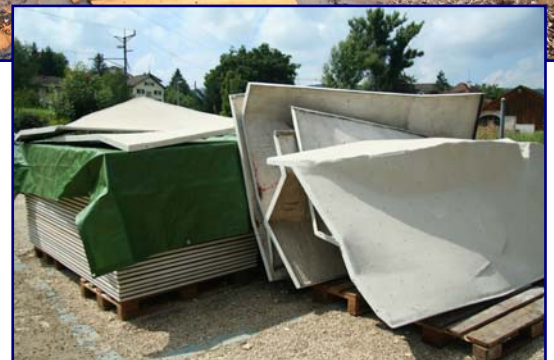
Das Hochwasser hinterlässt seine Spuren am 9. August 2007: mit einem Sondereinsatz werden die vorbereiteten Elemente zur Kletterwand gereinigt und getrocknet (rechts).