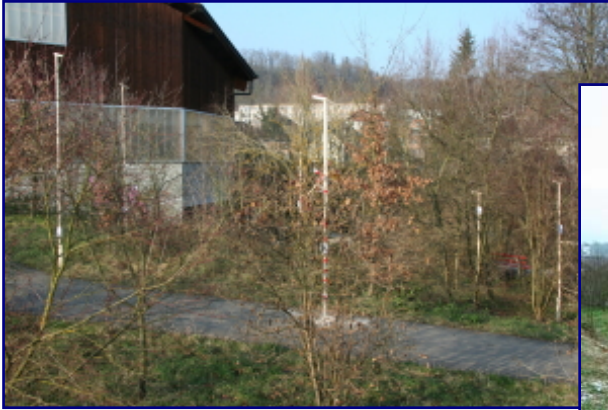
23. Dezember 2006: Die Bauprofilstangen wurden aufgestellt (links)