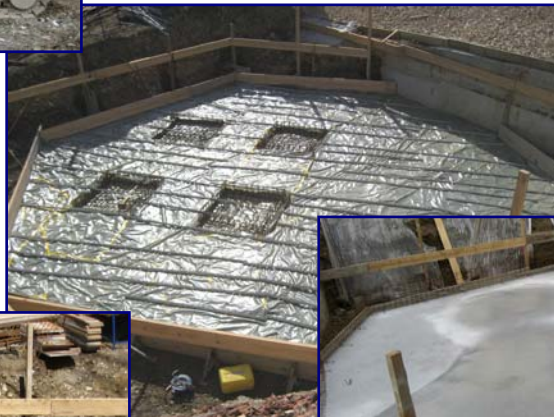
19. Juni: Die ersten Seitenwände (unten)