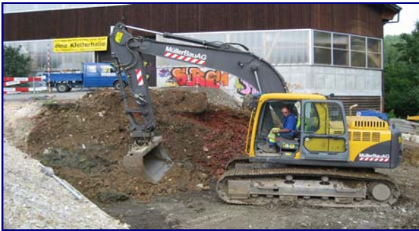
21. Mai: Aushubarbeiten (oben)